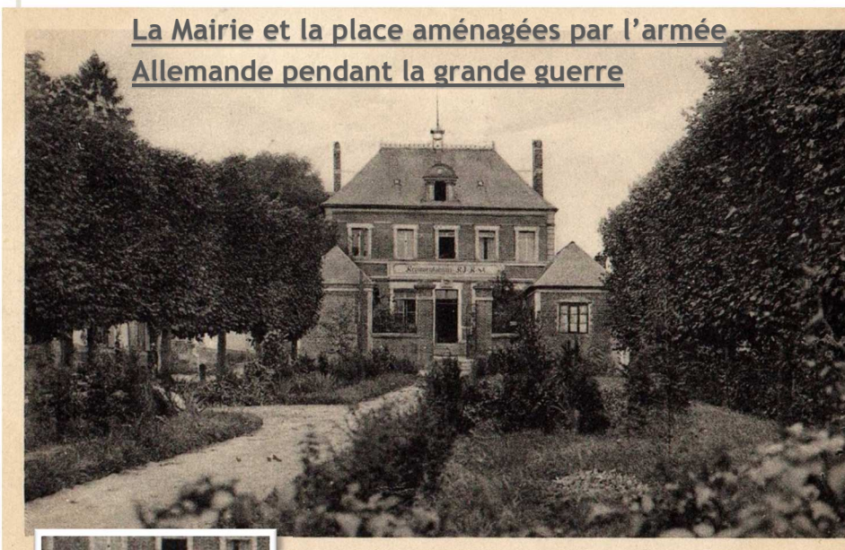
La Mairie et la place aménagées par l'armée Allemande pendant la grande guerre