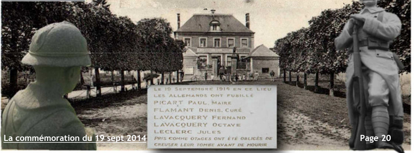
La commémoration du 19 sept 2014

Lagny s'est souvenu Le 19 septembre 2014, 100 ans après