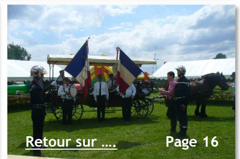
Retour sur ....