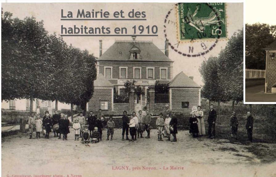
LAGNY, près Noyon. - La Mairie