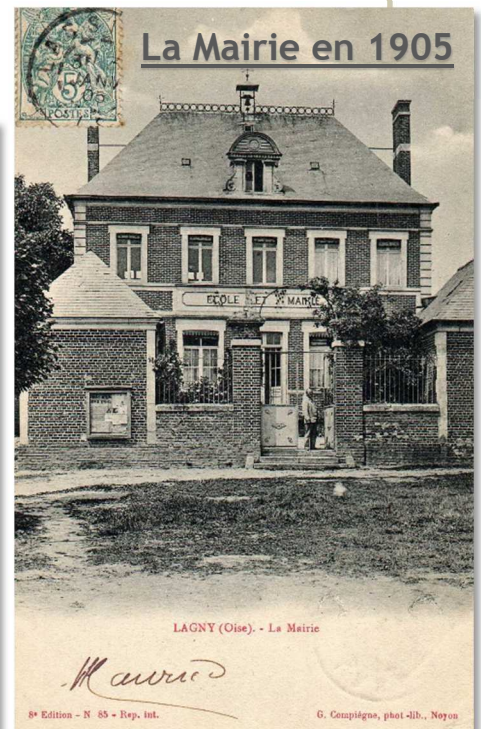
LAGNY (Oise). - La Mairie