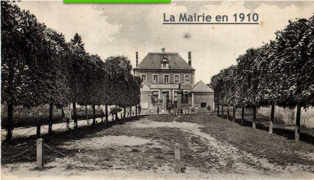
2 LAGNY (Oise) — Place et Mairie.