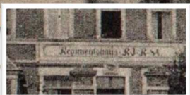
Inscription en Allemand sur le Fronton de La Mairie en 1914